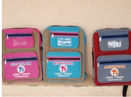
Les motxiles que s'entreguen als alumnes dels 3 centres, entre d'altre material escolar

mantenint els criteris i filosofia de l'organització. D'aquesta manera, el tarannà que COPE Trust dóna als seus projectes també es va estenent mica en mica per la regió.